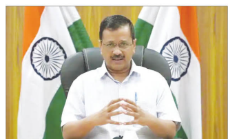
and St. Stephen's Hospital.

On July 30, the chief minister set up four committees to look into Covid deaths more specifically covering 10 hospitals - both public and private - that include Lok Nayak Hospital, GTB Hospital, Safdarjung Hospital, Max East & West, Sir Ganga Ram Hospital, RML Hospital, Jaipur Golden Hospital, Sri Balaji Action Medical Institute, Escorts,